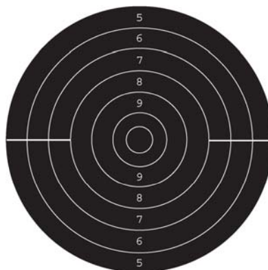
Fig.1 - blanco tiro rápido